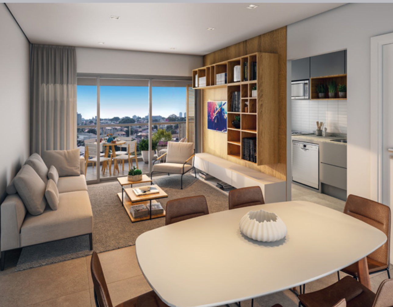
Perspectiva artística do apartamento tipo 2 dorms. de 66,65 m 2 privativos – final 5. Vista referente ao 7º andar.