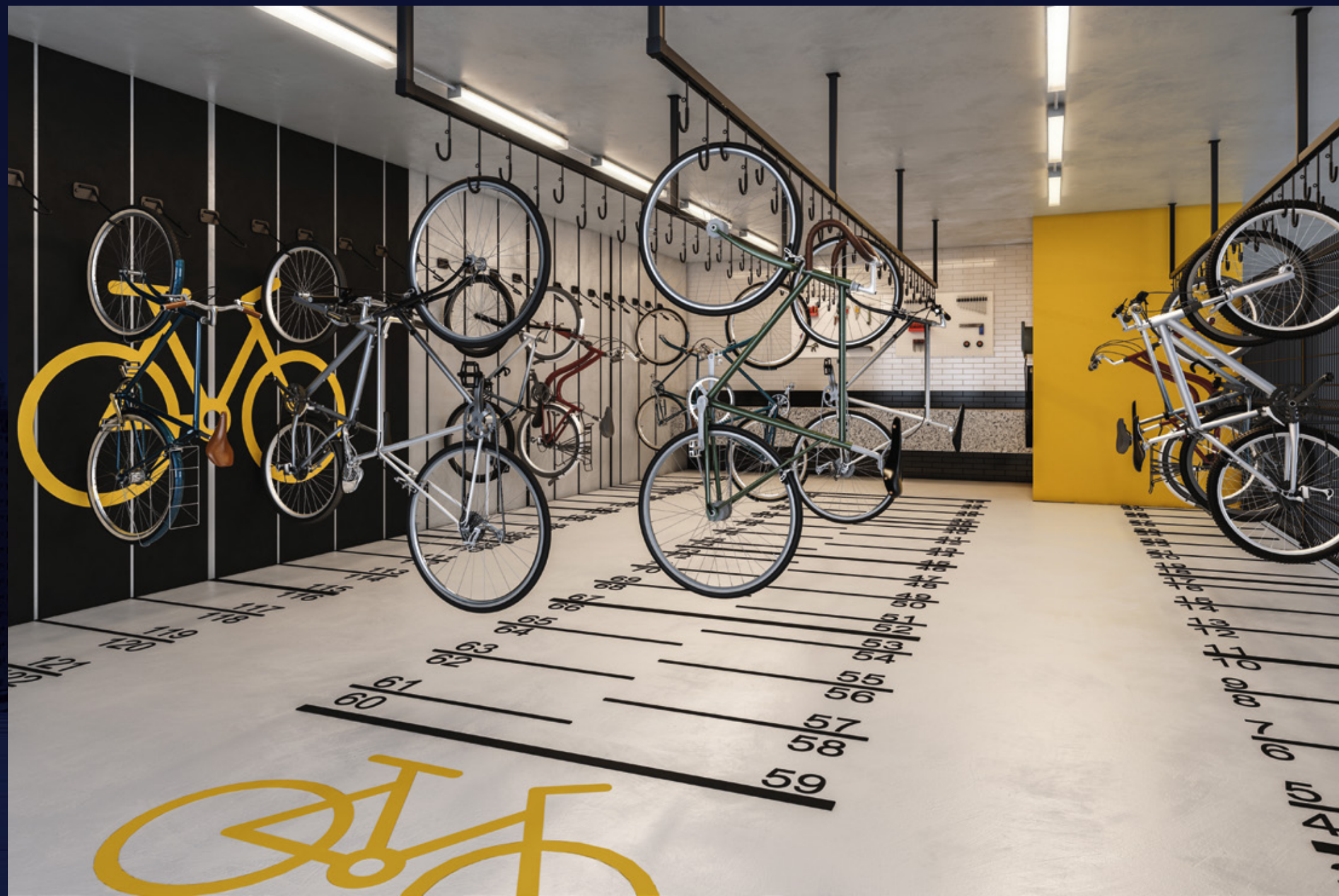
Perspectiva artística do bicicletário.

Espaços que complementam e melhoram sua rotina.