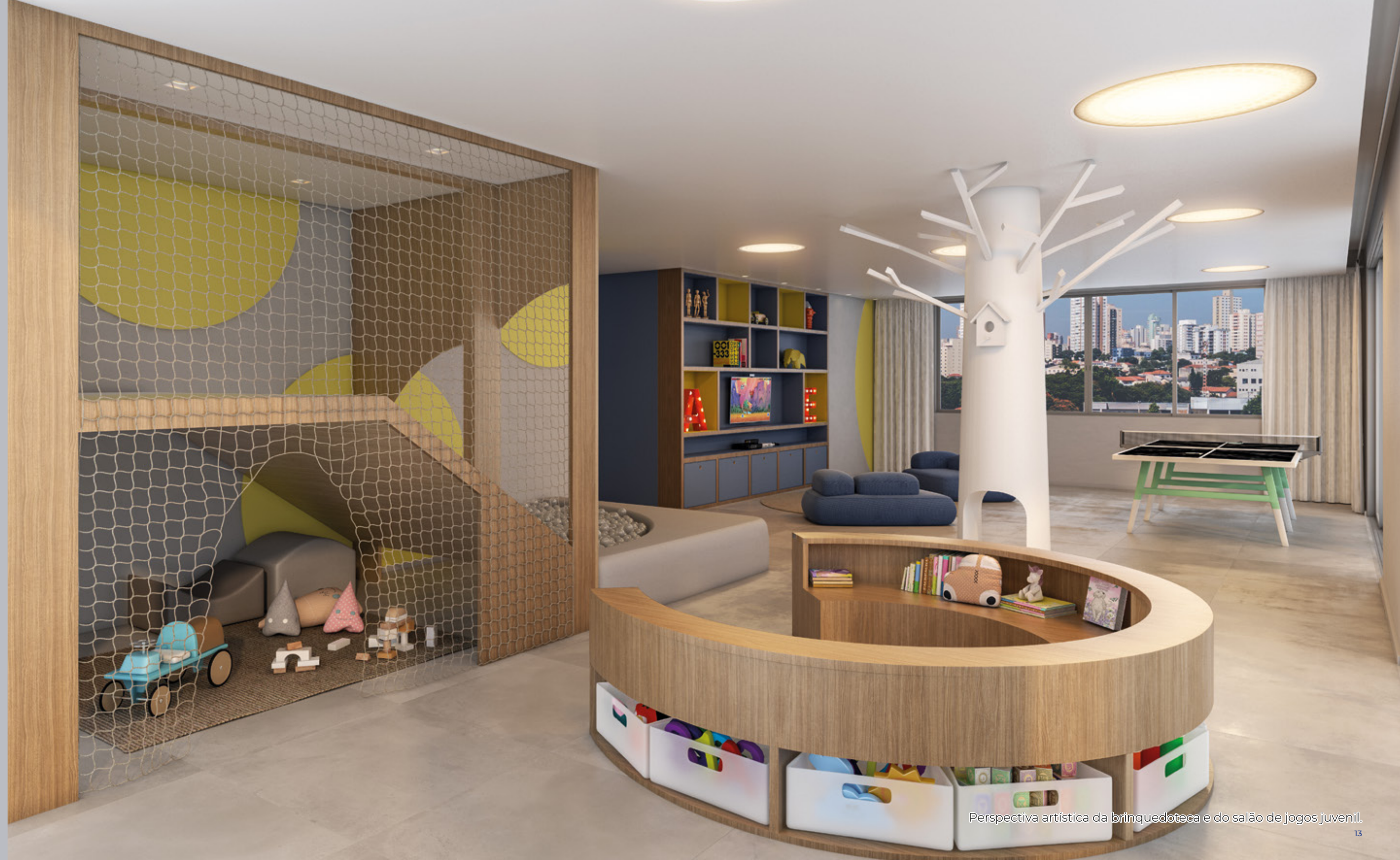
Perspectiva artística da brinquedoteca e do salão de jogos juvenil.