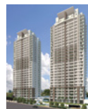
Paulista Home Resort Frei Caneca - São Paulo - SP.