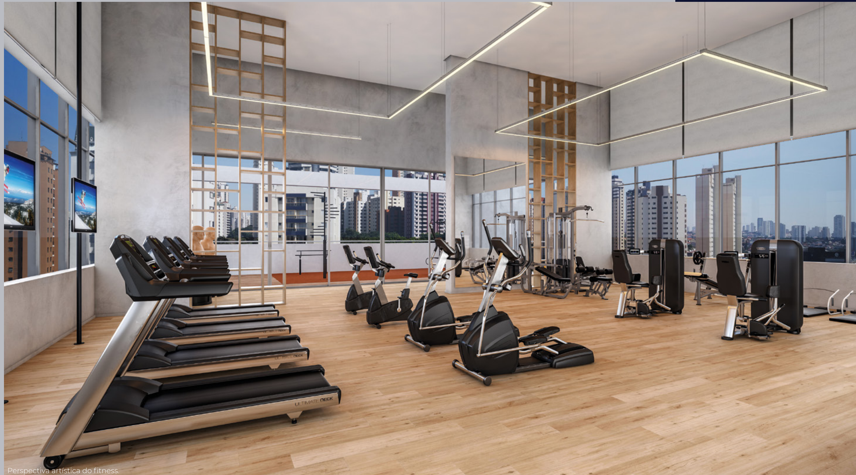
Perspectiva artística do fitness.

Um clima que inspira saúde e cuidado com o corpo.