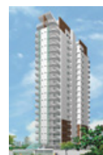
L'Officina São Paulo - SP.