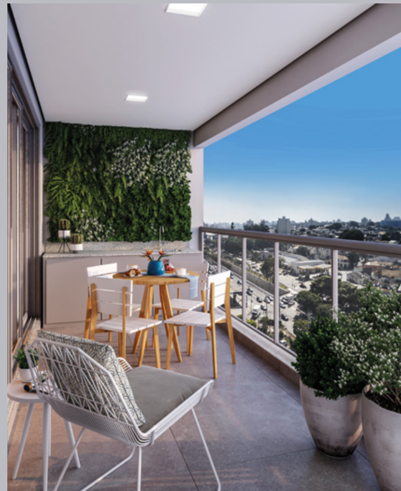
Perspectiva artística do terraço do apartamento tipo, 2 dorms. de 66,65 m 2 privativos – final 5. Vista aproximada referente ao 7º andar.