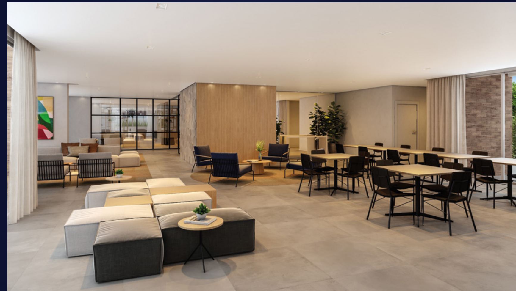
Perspectiva artística do salão de festas.

Uma extensão da casa para reunir o jantar em família à festa com os amigos.