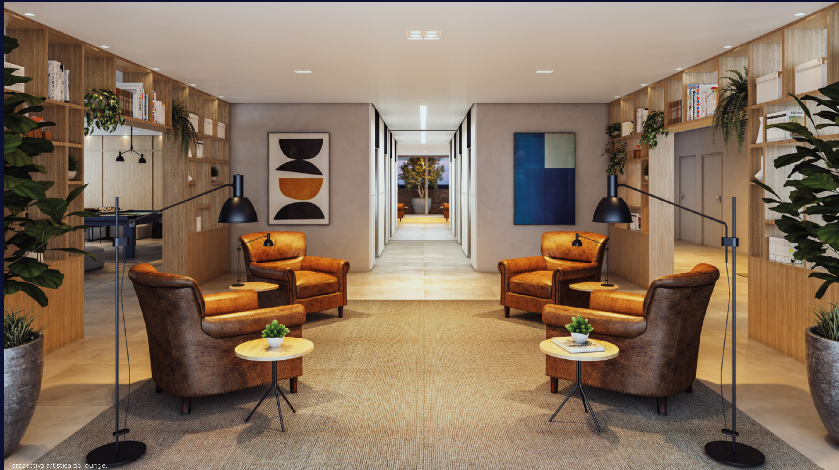
Perspectiva artística do lounge.

Espaços de lazer e vivência que são puro charme.