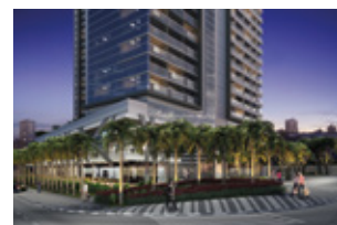
ComVem Bosque Maia.

Plataforma dedicada ao desenvolvimento e administração de centros de conveniência estabelecidos majoritariamente em cidades de grande densidade demográfica e econômica. Para locação de lojas, entre em contato com nossa equipe comercial - telefone: 11 4793-7555 | E-mail: comercial@hbrrealty.com.br