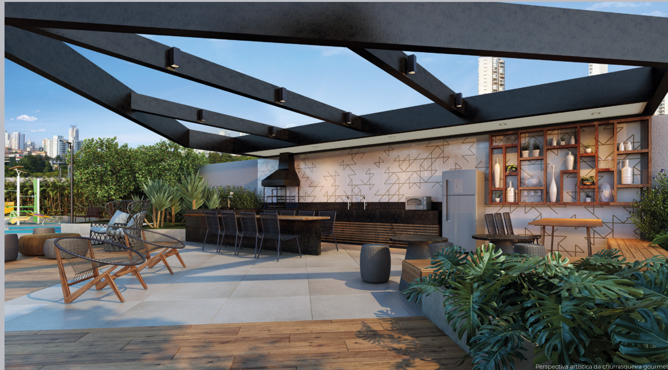
Perspectiva artística da churrasqueira gourmet.