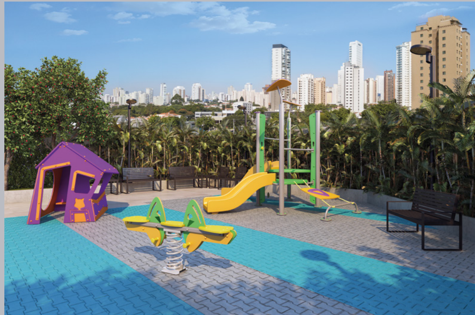
Perspectiva artística do playground.

Diversão garantida para as crianças, mesmo sem sair de casa.