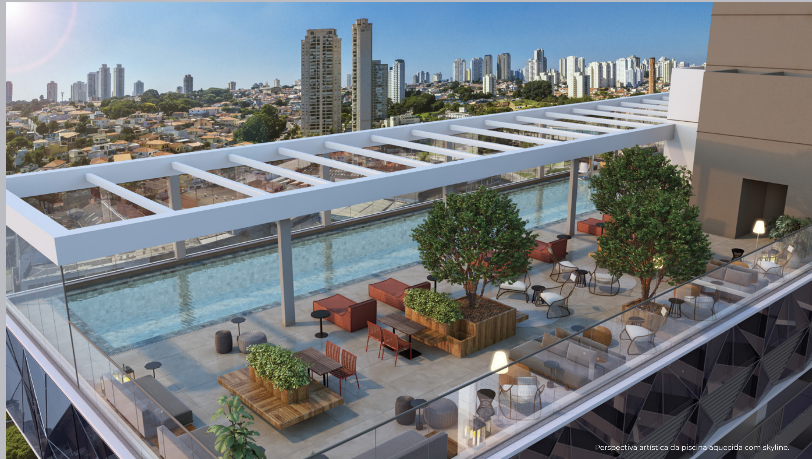
Perspectiva artística da piscina aquecida com skyline.