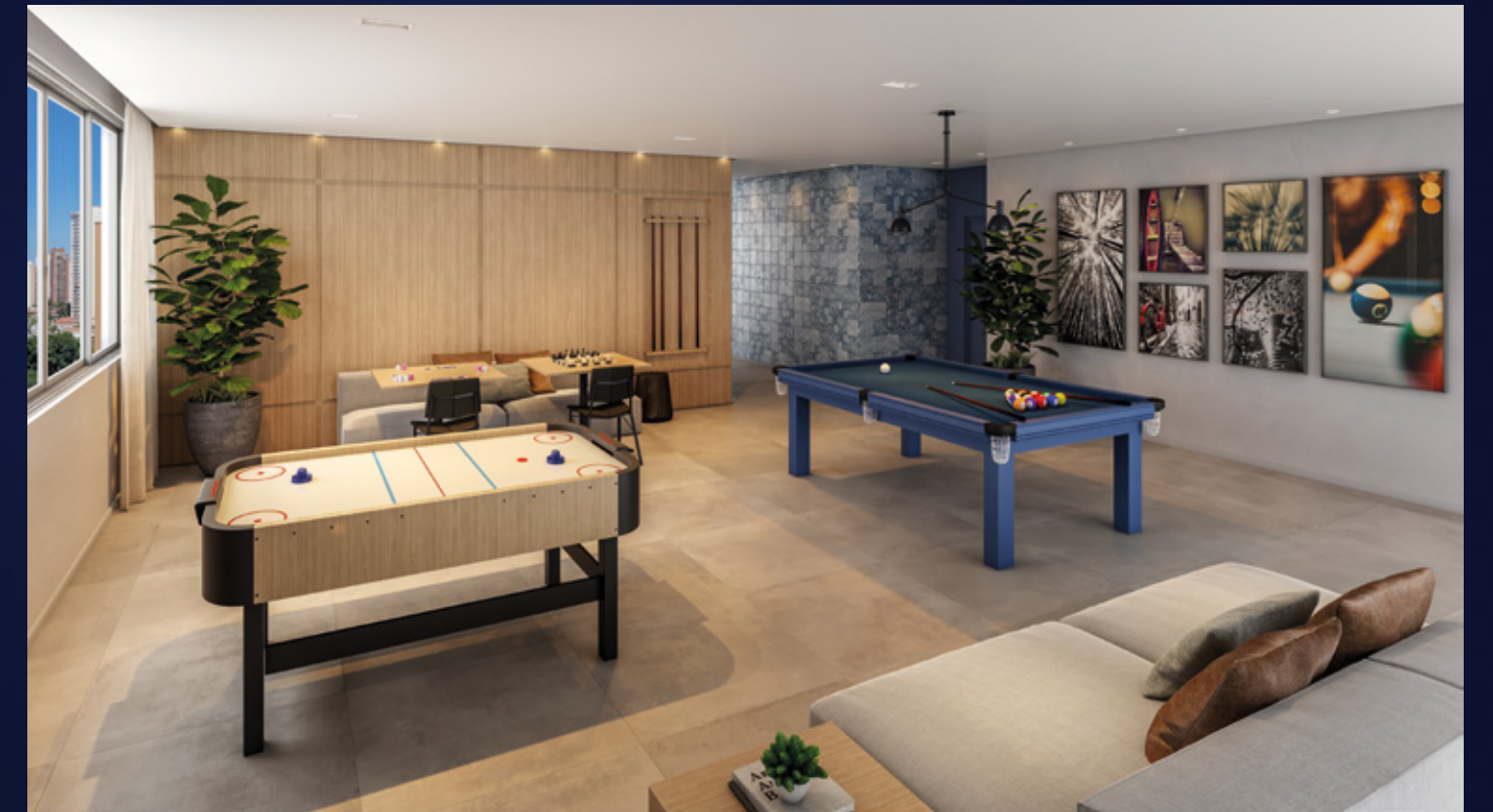
Perspectiva artística do salão de jogos adulto.

Espaços de lazer e vivência que são puro charme.