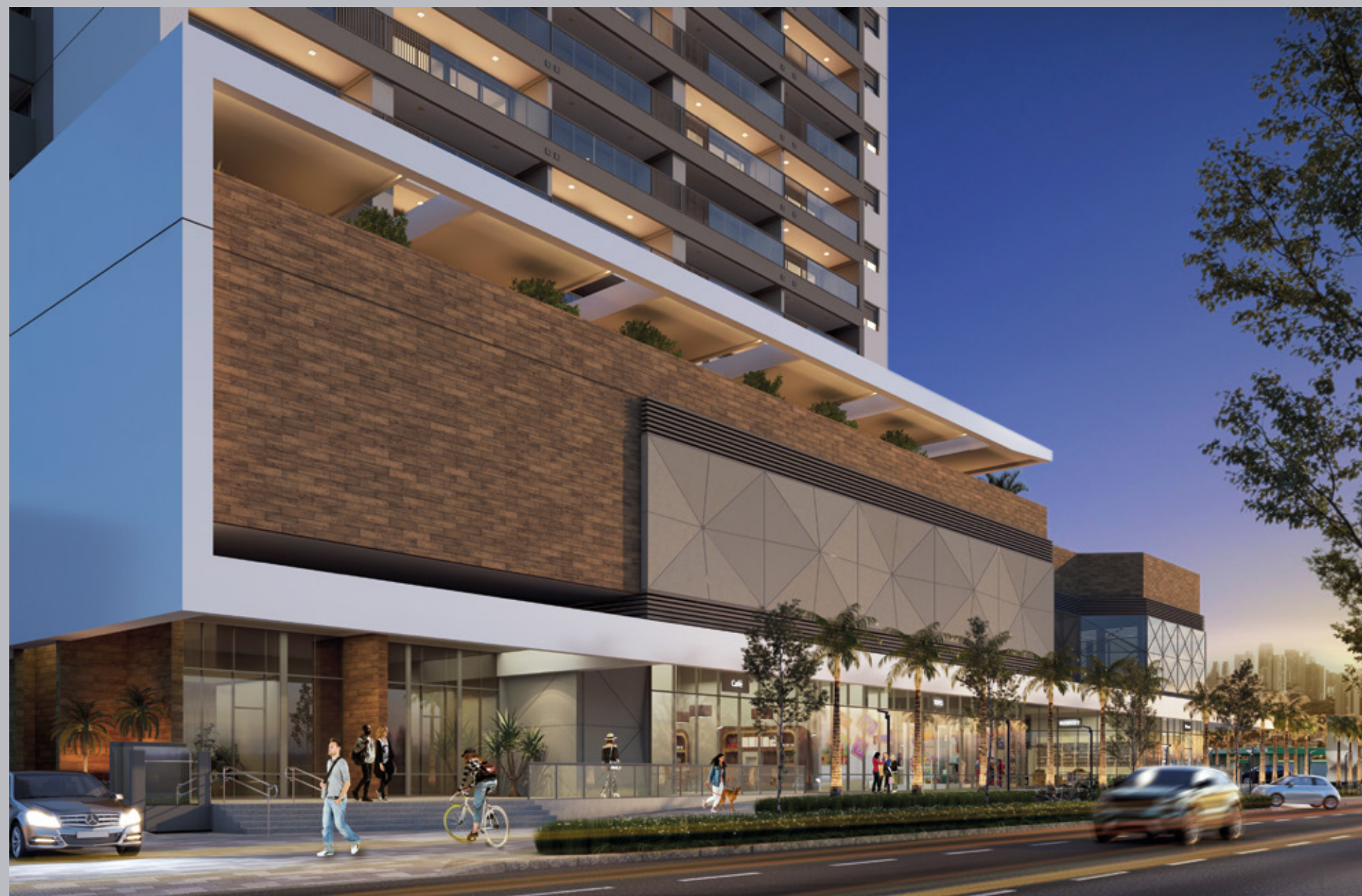
Perspectiva artística do acesso.

Seja recebido todos os dias por um design incrível.