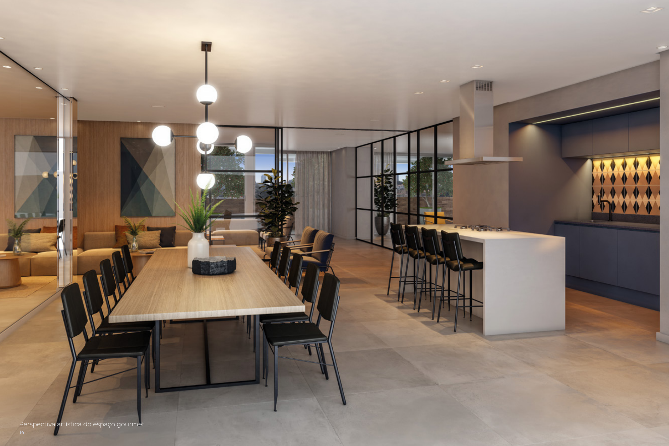
Perspectiva artística do espaço gourmet.

Uma extensão da casa para reunir o jantar em família à festa com os amigos.