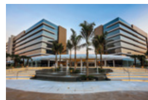
ComVem Patteo Mogilar.