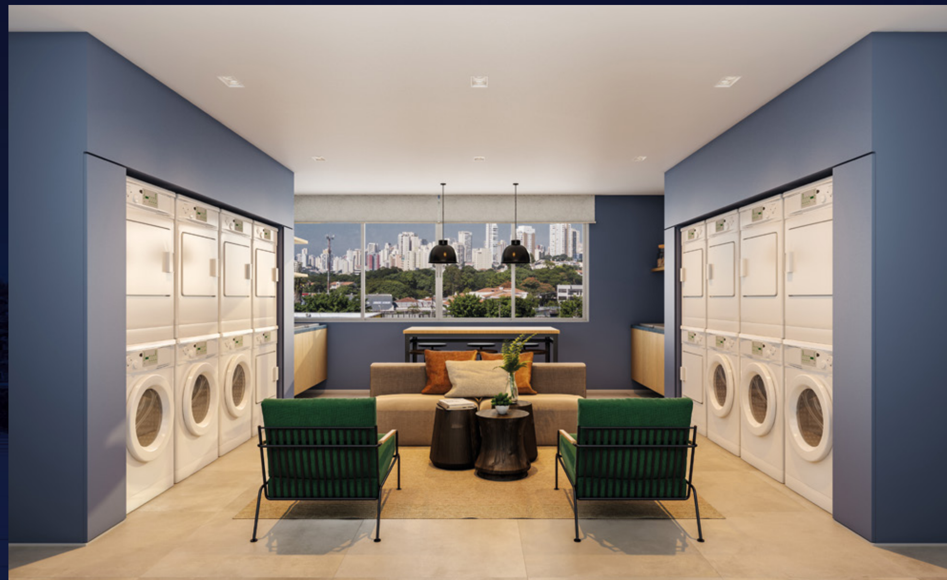
Perspectiva artística da lavanderia.

Espaços que complementam e melhoram sua rotina.