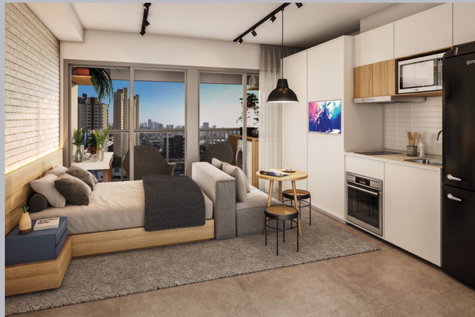
Perspectiva artística do apartamento tipo studio de 25,53 m 2 privativos – final 16. Vista aproximada referente ao 7º andar.