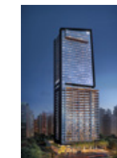
W Residences São Paulo São Paulo - SP.

- Atuação como incorporadora imobiliária - 42 mil unidades entregues - Presente em 30 cidades, 10 estados e no DF - 10 Prêmios Master Imobiliário - 10 Top Imobiliários.