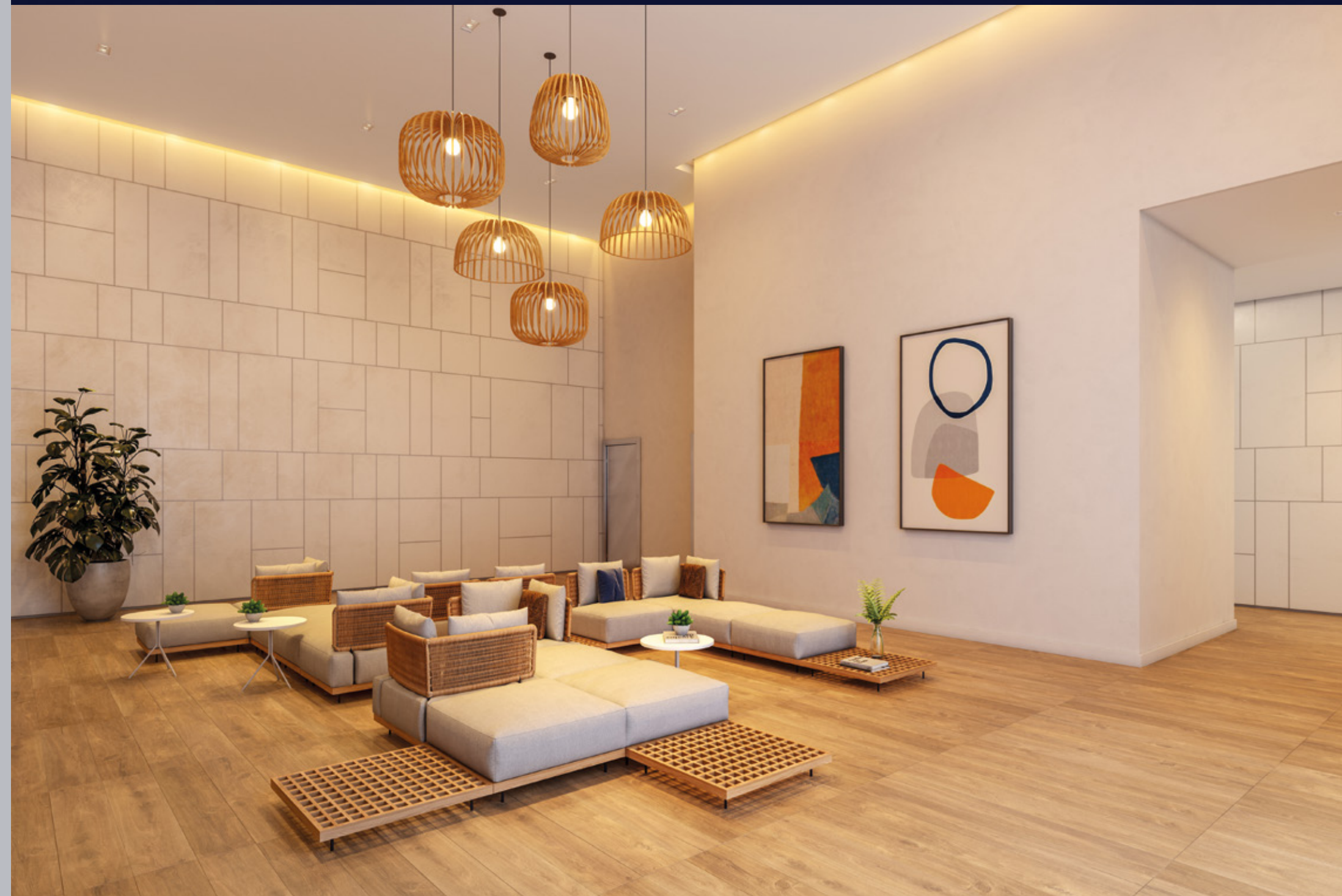
Perspectiva artística do lobby.