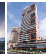
Helbor Nun Vília Nova São Paulo - SP.