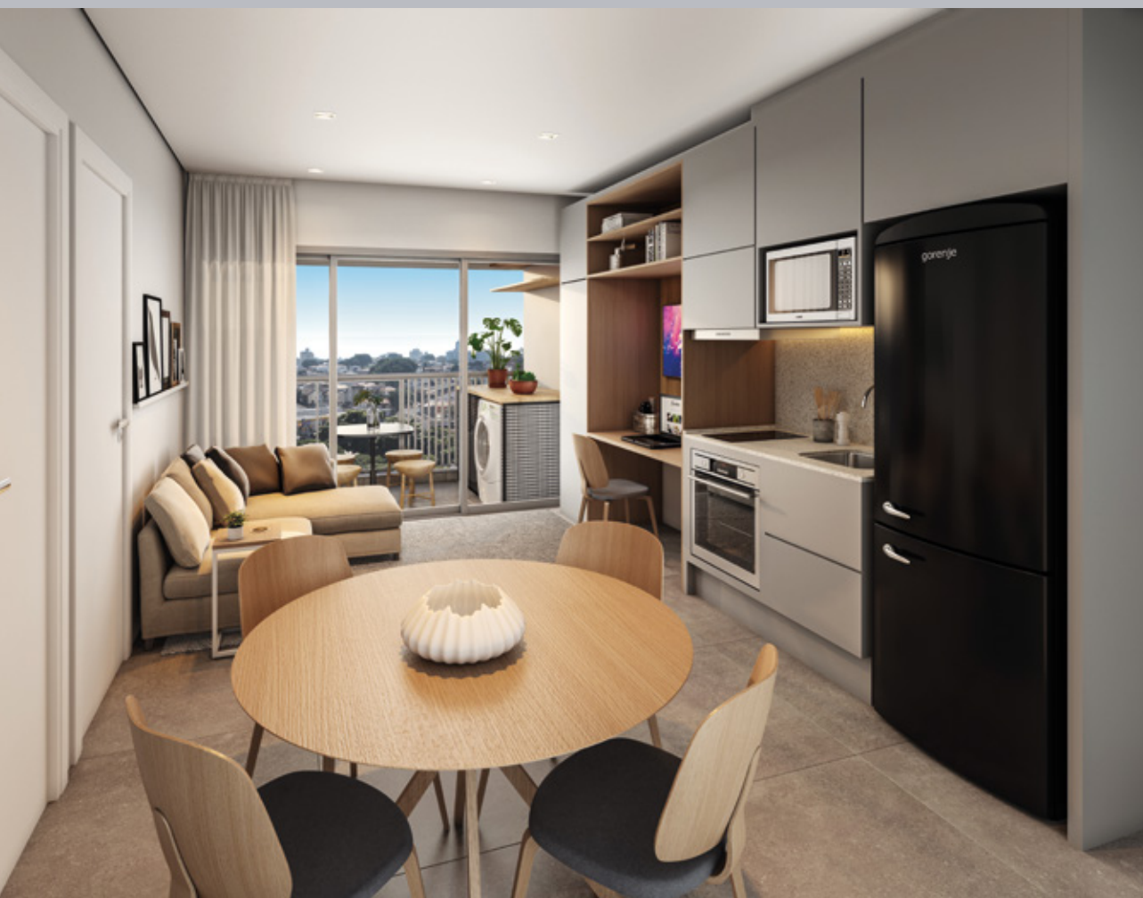
Perspectiva artística do apartamento tipo 1 dorm. de 40,74 m 2 privativos – final 2. Vista aproximada referente ao 7º andar.