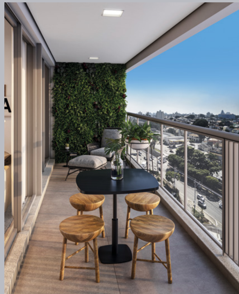
Perspectiva artística do terraço do apartamento tipo, 1 dorm. de 40,74 m 2 privativos – final 2. Vista aproximada referente ao 7º andar.