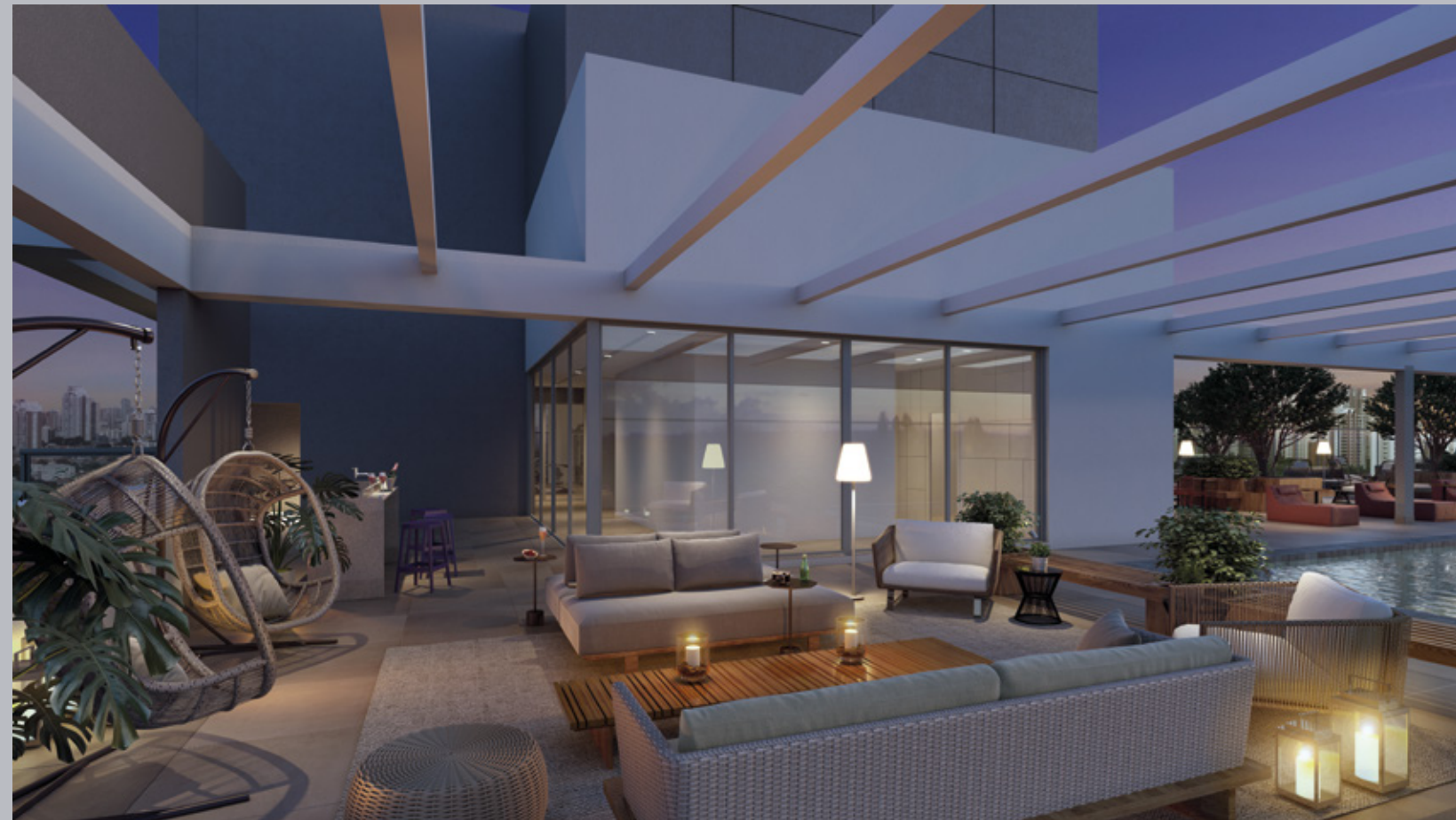
Perspectiva artística do rooftop.

Esqueça a cidade sem precisar sair dela.