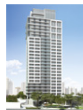
Frei Caneca Comercial São Paulo - SP.

Fundada em 2000, a Toledo Ferrari atua no segmento de construção e incorporação. Com foco em empreendimentos residenciais e comerciais de médio e alto padrão. Tem em seu portfólio 3,5 milhões de metros quadrados em empreendimentos na região metropolitana de São Paulo e cidades do interior do estado. Investe continuamente em parcerias com conceituadas empresas do setor, o que, em conjunto com a sua competente equipe de gestão imobiliária e construção, consolidou a marca Toledo Ferrari no mercado imobiliário brasileiro. Esses fatores resultaram em números expressivos, além da conquista de diversos prêmios relevantes do setor: 56 edifícios concluídos, 7.740 unidades entregues e 2,4 milhões de m 2 construídos.