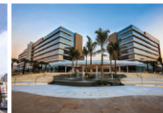
Helbor Patteo Mogilar Skymall & Offices Mogi das Cruzes - SP.