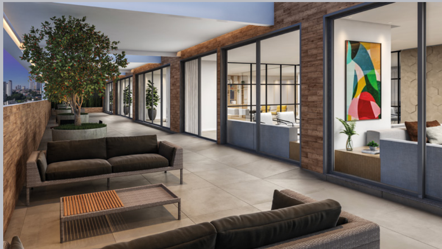
Perspectiva artística do terraço de apoio ao salão de festas.