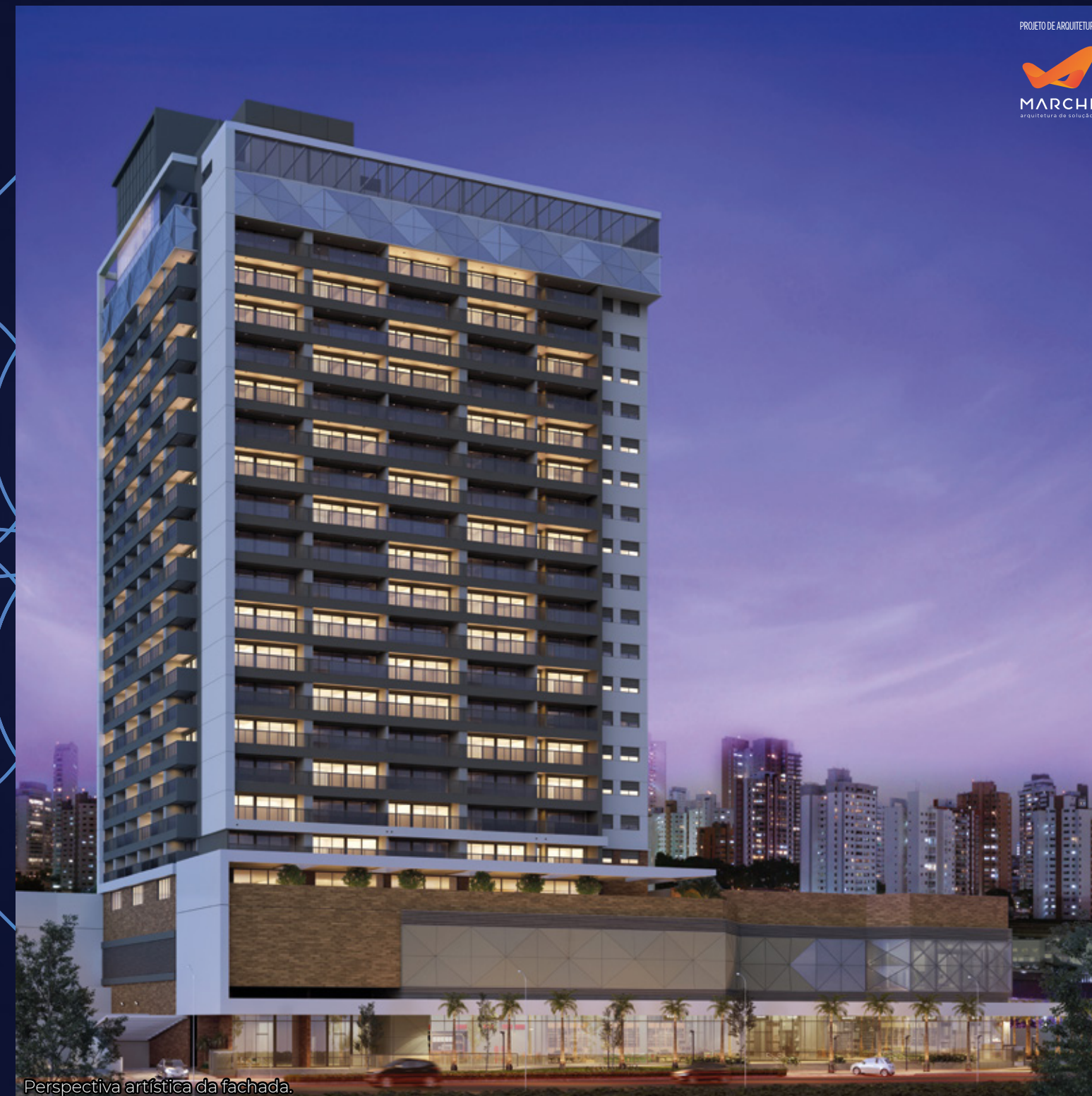
Perspectiva artística da fachada.

Projeto de paisagismo: Benedito Abbud Arquitetura Paisagística.