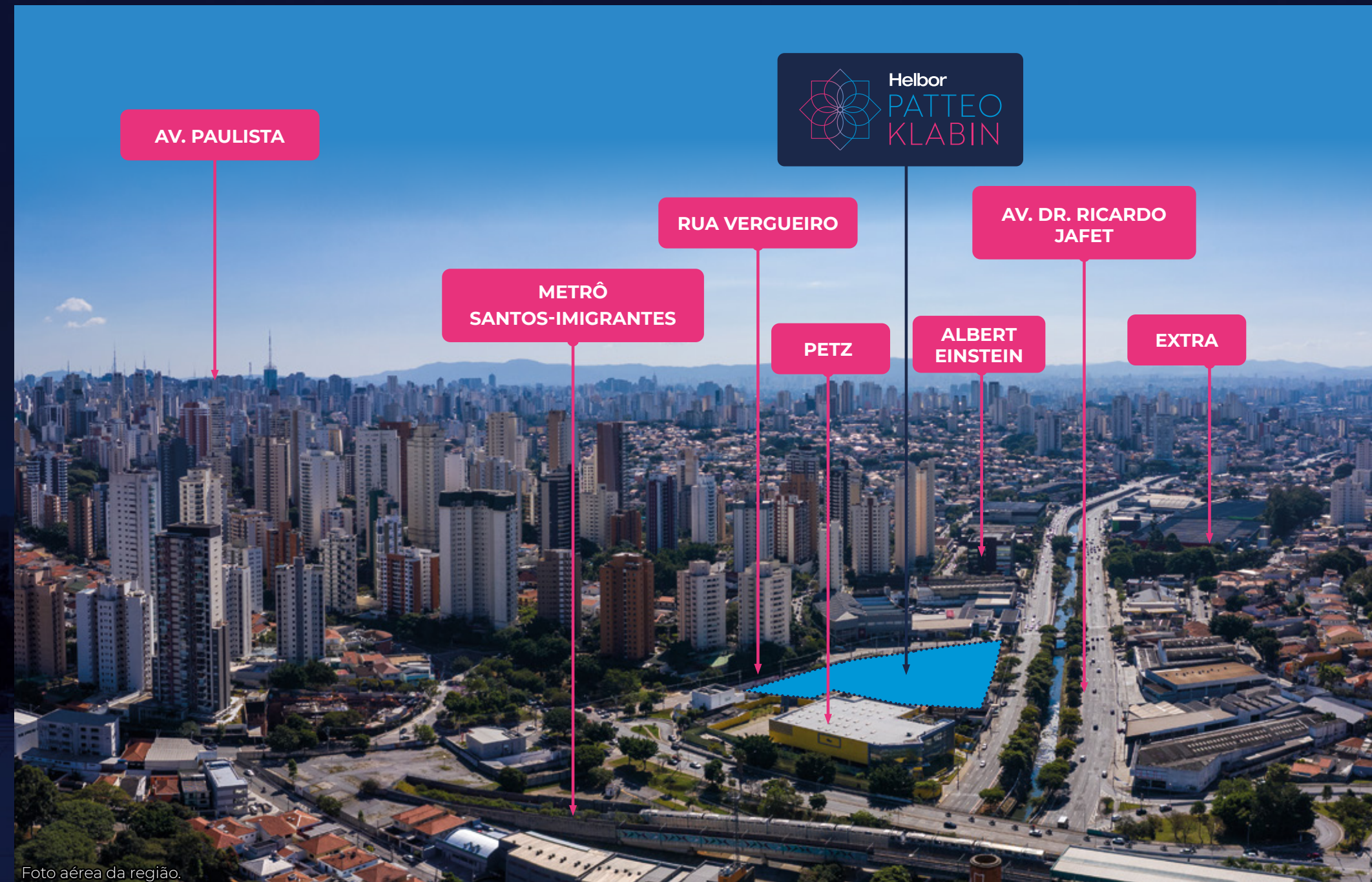
Foto aérea da região.

Gastronomia e entretenimento em um entorno cheio de charme.