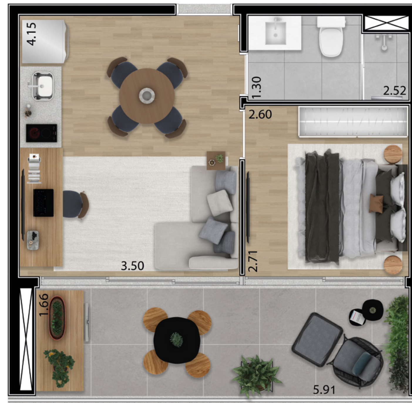
Planta artística do apartamento tipo 1 dorm., final 2, 40,74 m 2 privativos (do 3º ao 19º andar), com sugestão de decoração. Os móveis, eletrodomésticos, eletrônicos e elementos de decoração não fazem parte do contrato de compra e venda da unidade. Medidas de face a face.