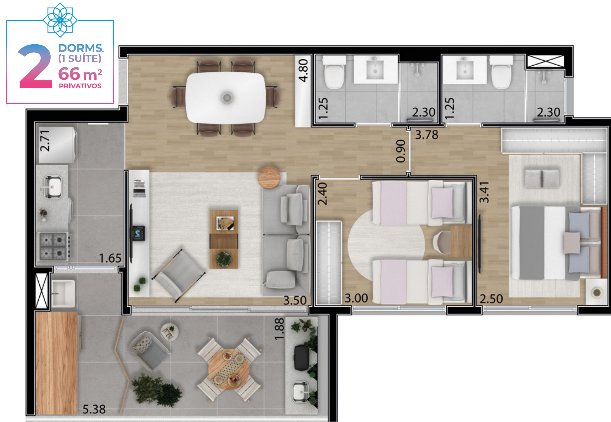
Planta artística do apartamento tipo 2 dorms. – final 5 – 66,65 m 2 privativos (do 3º ao 19º andar). Com sugestão de decoração. Os móveis, eletrodomésticos, eletrônicos e elementos de decoração não fazem parte do contrato de compra e venda da unidade. Medidas de face a face.