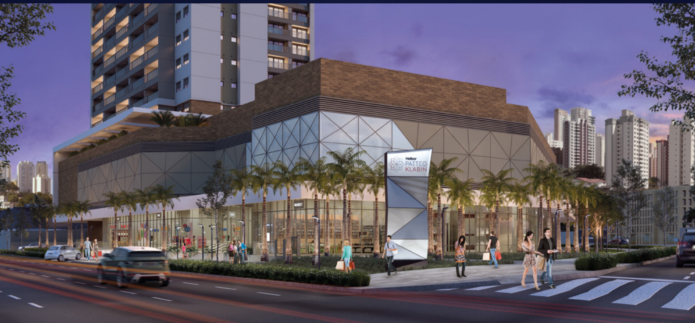
Perspectiva artística do acesso ao ComVem.