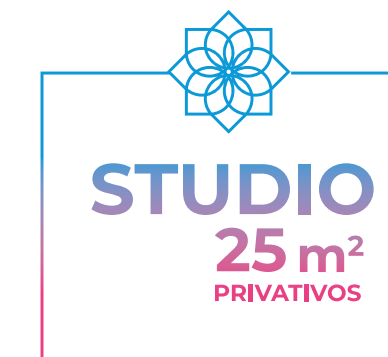
Planta artística do apartamento tipo studio – final 16 – 25,53 m 2 privativos (do 3º ao 19º andar). Com sugestão de decoração. Os móveis, eletrodomésticos, eletrônicos e elementos de decoração não fazem parte do contrato de compra e venda da unidade. Medidas de face a face.